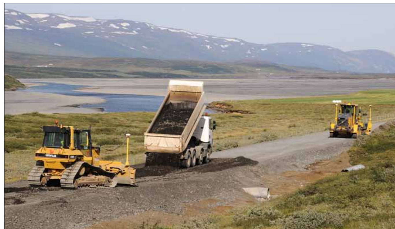
Hróarstunguvegur (925), endurbygging vegar og bundið slitlag 5,6 km. Verktaki: Ylur ehf. Jökulsá á Dal í baksýn. Myndin var tekin 29. ágúst 2013.