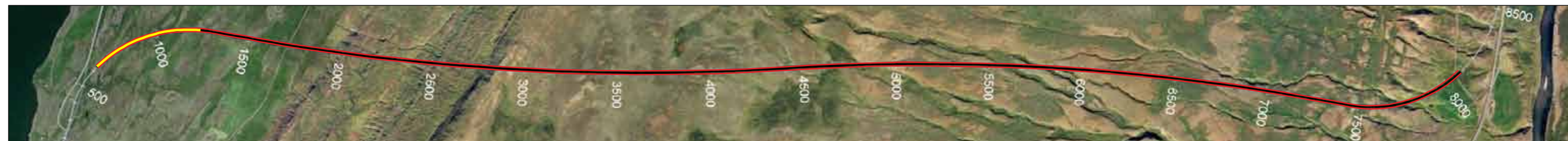
Vaðlaheiðargöng, staða framkvæmda 16. september 2013, Búið er að sprengja 590 m frá Eyjafirði sem er 8,2% af heildarlengd.

Áður en vinna hefst við endurbætur á rafbúnaðinum þarf að sprengja út tvö lítil tækjarými í göngunum og styrkja þau með sprautusteypu. Að auki mun fara fram minni háttar viðhald á steypu í göngum. Þessi vinna er nú í gangi og mun standa yfir mestan hluta septembermánaðar. Loka þarf göngunum fyrir umferð nokkrar nætur meðan unnið er að sprengingum og steypuvinnu. Lokunin mun vara frá 23:00 á kvöldin og til 06:30 á morgnana aðfaranætur þriðjudaga til föstudaga. Lokun ganganna mun verða auglýst sérstaklega í hvert sinn. Það skal tekið fram að viðbragðsaðilar geta farið um göngin