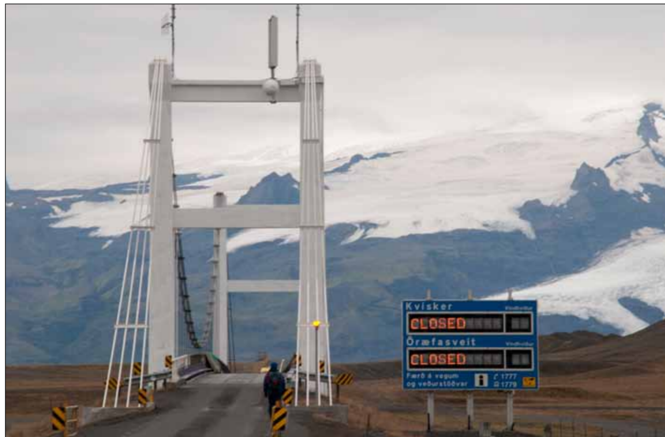
Til bráðabirgða verður nú birt enska orðið „CLOSED“ á ljósaupplýsingaskiltum Vegagerðarinnar í stað „ÓFÆRT“. Það verður reglan á meðan fundin er lausn á að koma upplýsingum til vegfarenda sem ekki skilja íslensku. Myndin er frá Jökulsárlóni og var breytt í tölvu.